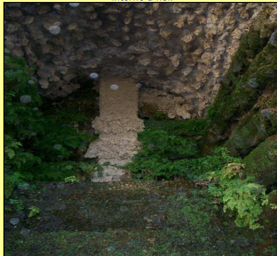
Villa D'Este - Tivoli

Queste sono le mie foto per trasferirvi una testimonianza personale circa l'esistenza di queste presenze meravigliose intorno a noi.