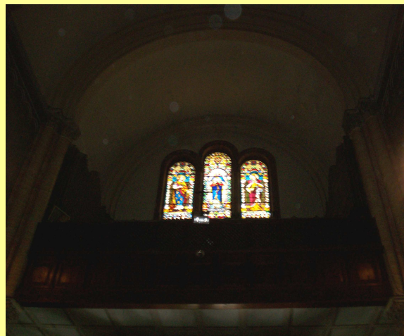
Chiesa di San Francesco - Napoli